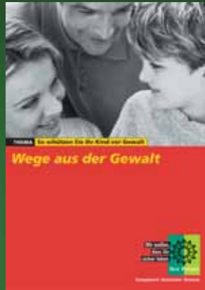
Broschüre zum Thema Gewaltschutz