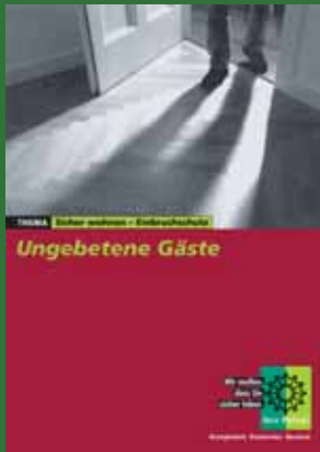
Broschüre zum Thema Wohnungseinbruchschutz