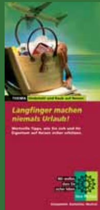
Faltblatt zum Thema Diebstahl auf Reisen