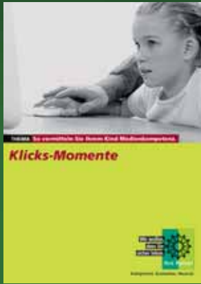
Broschüre zum Thema Medienkompetenz

Informationsmaterial mit wertvollen Präventionstipps erhalten Sie bei jeder (Kriminal-)Polizeilichen Beratungsstelle . Unter anderem zu folgenden Themen: