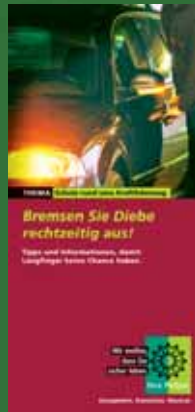
Faltblatt zum Thema KfZ-Diebstahl