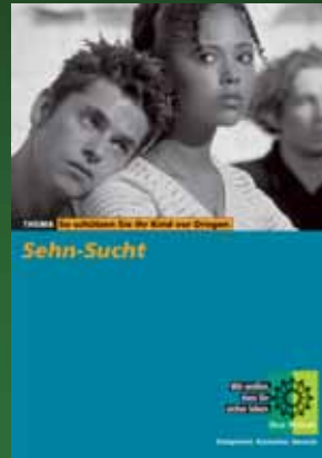
Broschüre zum Thema Drogenschutz