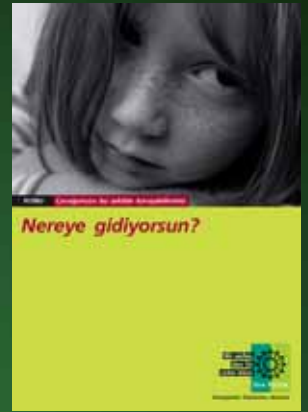
Broschüre zum Thema Kinderschutz in türkischer Sprache