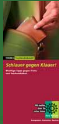
Faltblatt zum Thema Taschendiebstahl